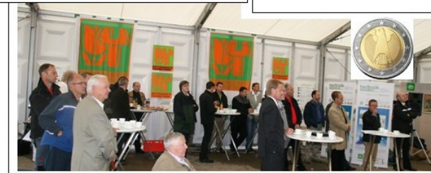
Eine Untersuchung der Informationsstelle für Unternehmensführung (IFU) im LBT Bundesverband im Auftrag der Bundes-Fachgruppe MOTORGERÄTE – BuFa-MOT